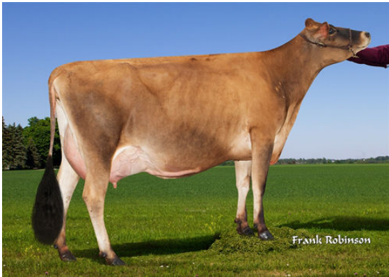
JX PROGENESIS CINDERELLA {6} DAM

JX PROGENESIS MONARCH {5} JX PROGENESIS CINDERELLA {6} DES-77%-4YR-USA JX SUNSET CANYON GOT MAID {5} PROGENESIS CRAZE CORDE {6} EX-90%-5YR-USA RIVER VALLEY CIRCUS CRAZE JX PROGENESIS GRACE TOO {5} DES-73%-2YR-USA